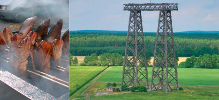
Forellen im Rauch